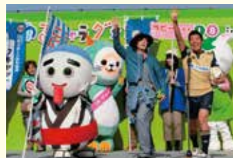
〔日刊スポーツより〕